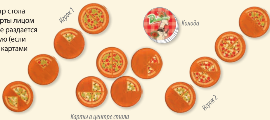
Карты в центре стола

В начале игры в центр стола выкладываются 4 карты лицом вверх, игрокам также раздаётся по 4 карты в открытую (если игра ведётся только картами с одной точкой, то раздаётся игрокам и выкладывается в центр по 3 карты).