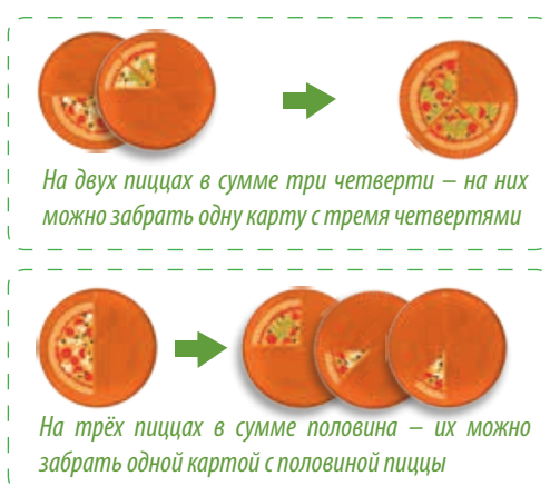
На двух пиццах в сумме три четверти – на них можно забрать одну карту с тремя четвертями

Если игрок в свой ход не может взять ни одной взятки – он добирает из колоды на руки одну дополнительную карту, а ход переходит к следующему игроку.