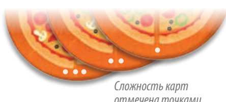
Сложность карт отмечена точками

В игре используются только круглые карты с пиццей. Сложность игры можно варьировать, отбирая карты соответствующей сложности: для начала лучше отобрать только карты с одной точкой, потом постепенно добавлять в колоду карты с двумя и тремя точками.